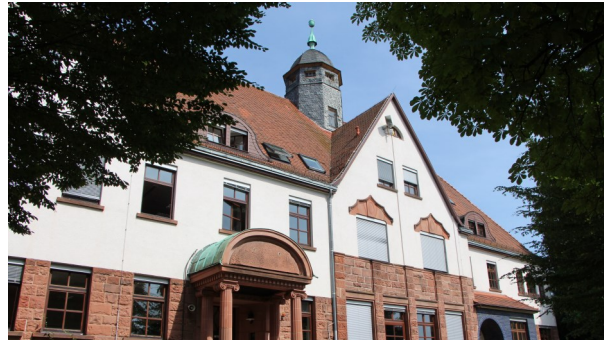
Schulstandort ehemaliges Landratsamt

Bei diesem Ausbildungsgang handelt es sich um eine vollschulische kaufmännische Ausbildung, die sich auch sehr gut für einen Wiedereinstieg in den Beruf eignet.