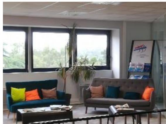
Sitzecke, wo man seinen Laptop nehmen kann, um dort entspannter zu arbeiten

Bei Medef arbeiten 15 Personen in verschiedenen Bereichen, wie z.B. Marketing, Rechtsabteilung, Rechnungswesen, oder als Manager um die Klienten zu beraten oder um neue Klienten anzuwerben.