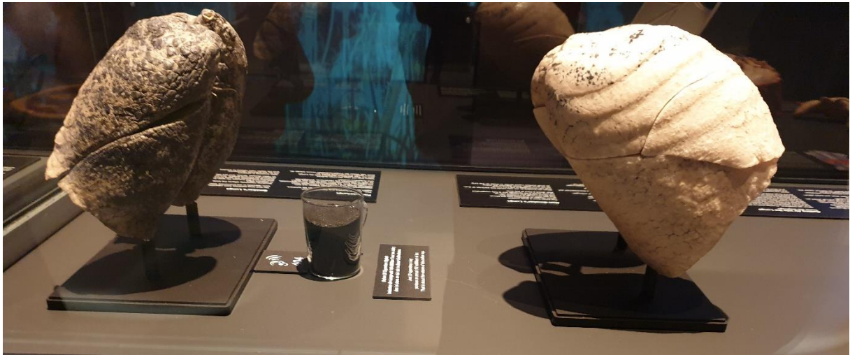
Menschliche Lunge: links die eines Rauchers und rechts ohne Zigarettenkonsum (Foto privat)